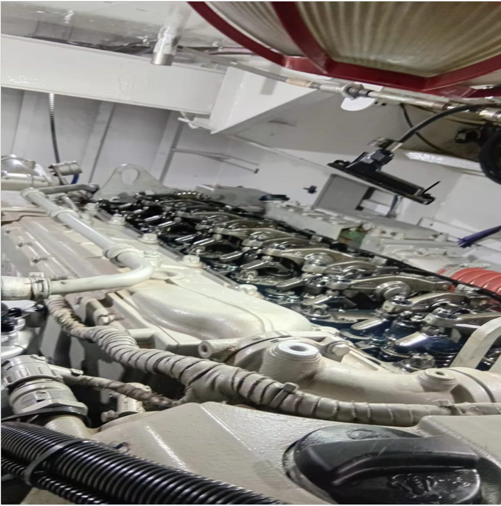
prueba y ajuste de válvulas motor