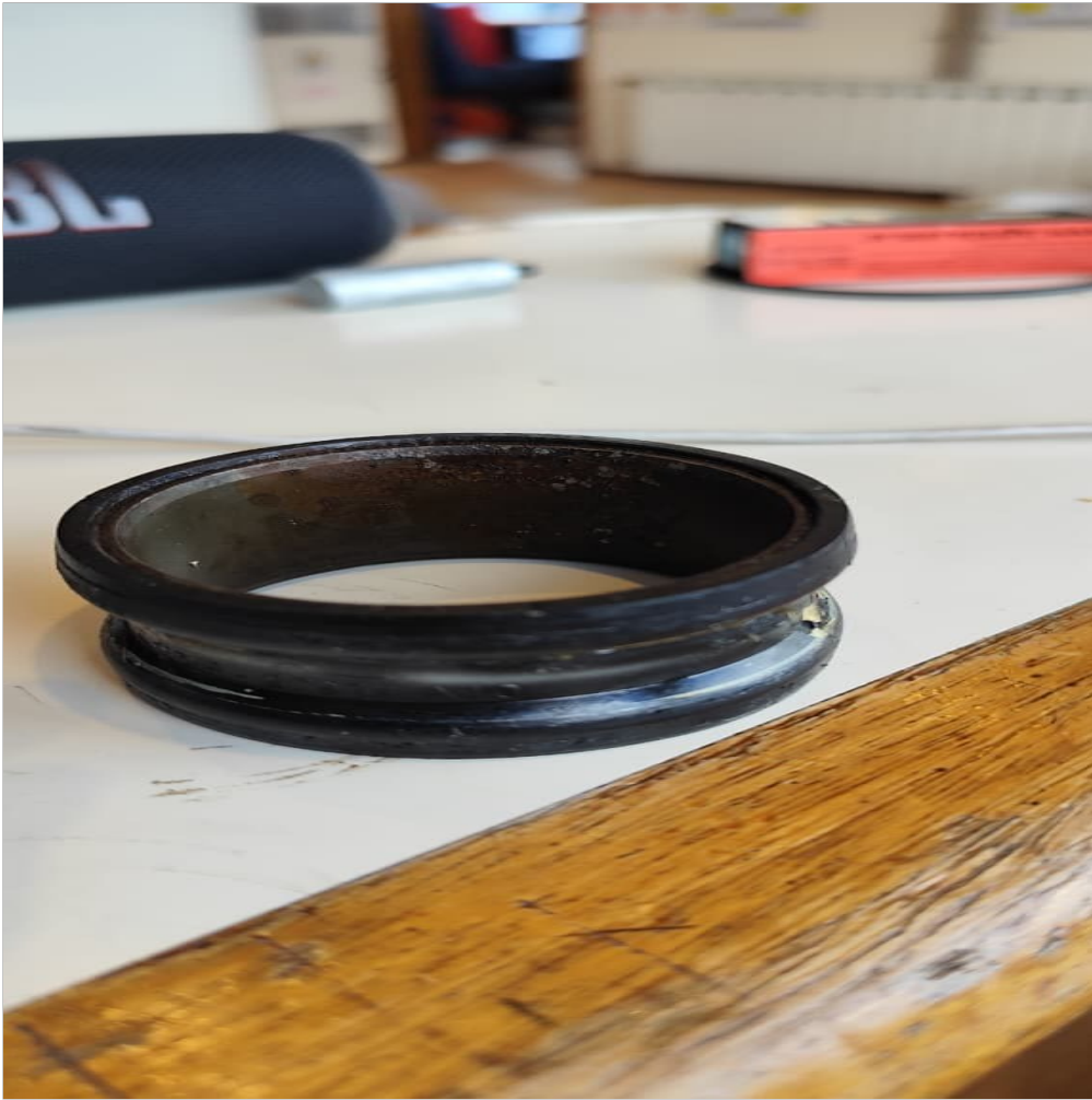
codo de agua acople con tanque compensador refrigerante