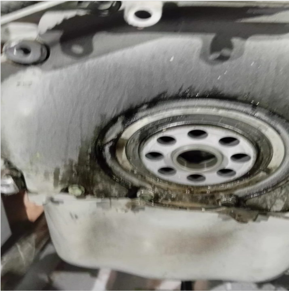
fuga de aceite por tapa de distribucion delantera