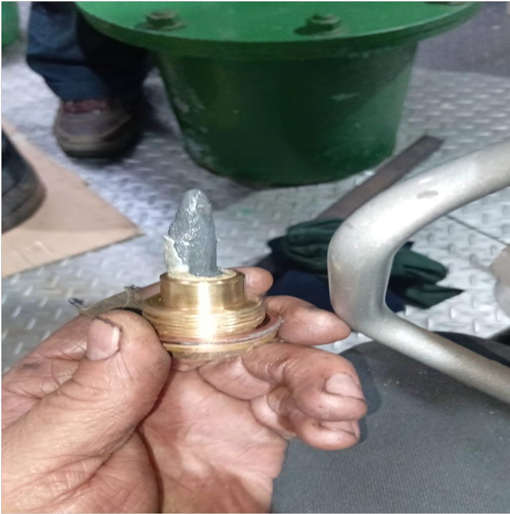
ánodo de sacrificio