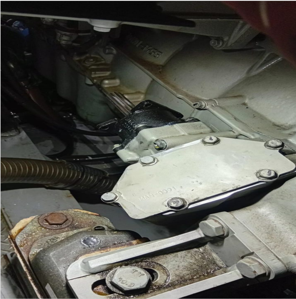
revisión en mando de bomba de agua