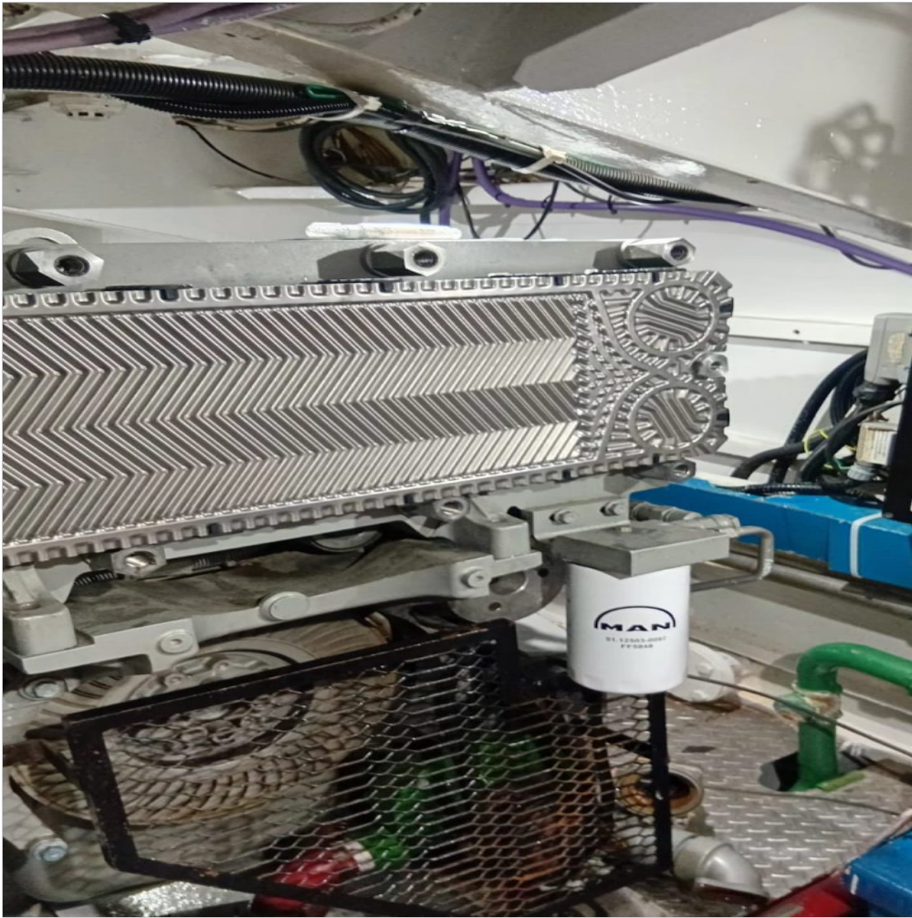
reemplazo de placas de enfriamiento