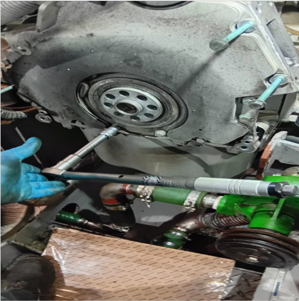
torque en tapa de distribución delantera