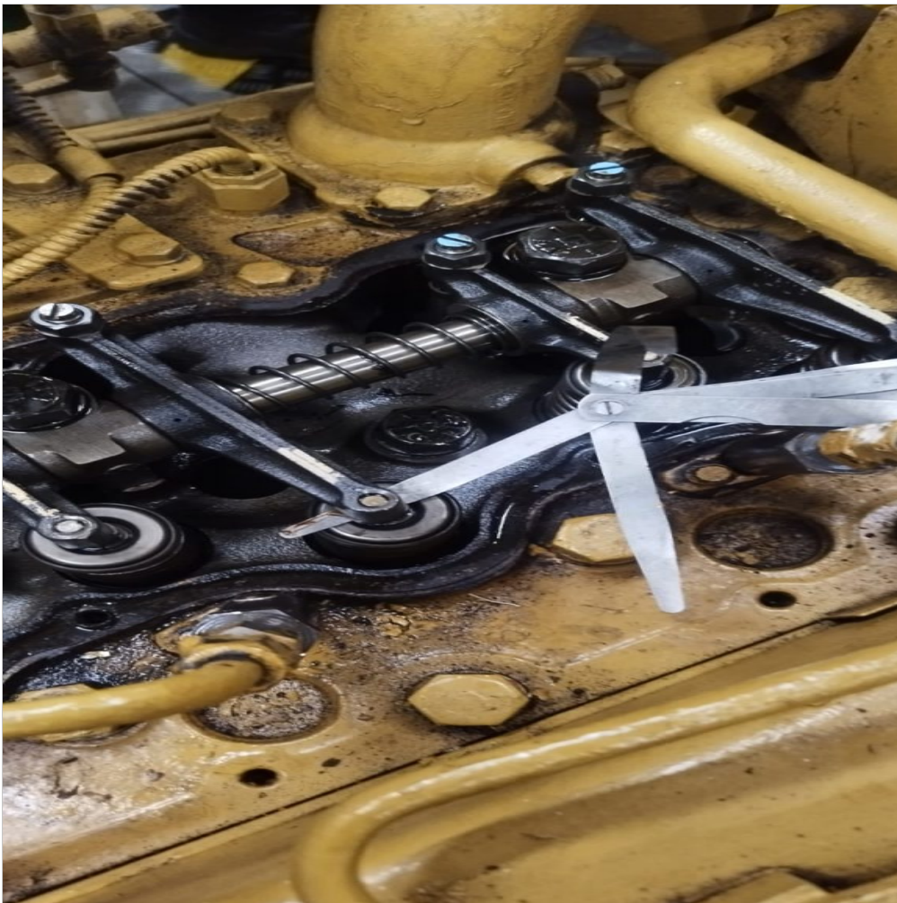
calibración de válvulas