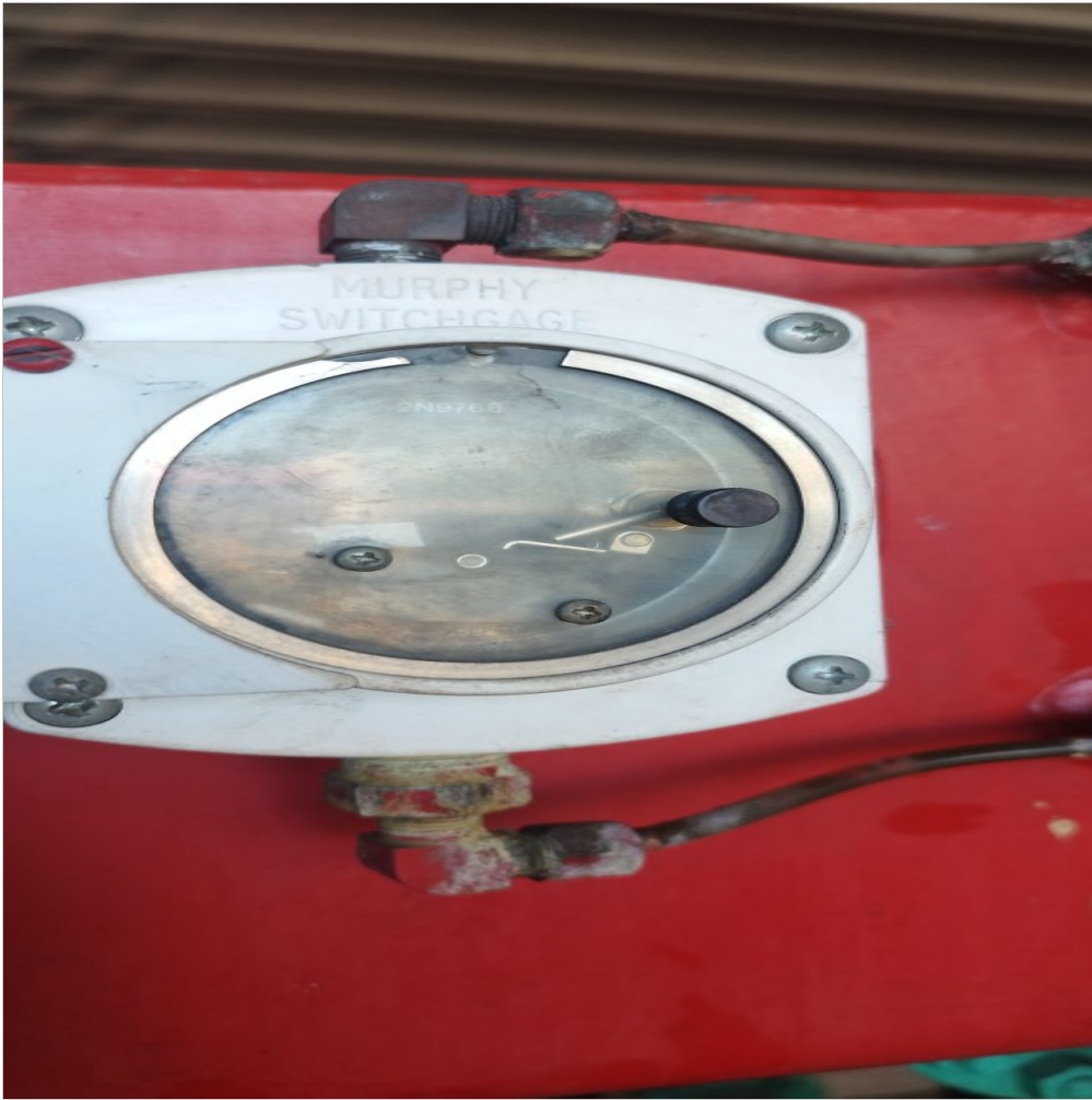
indicador de nivel de refrigerante no funciona