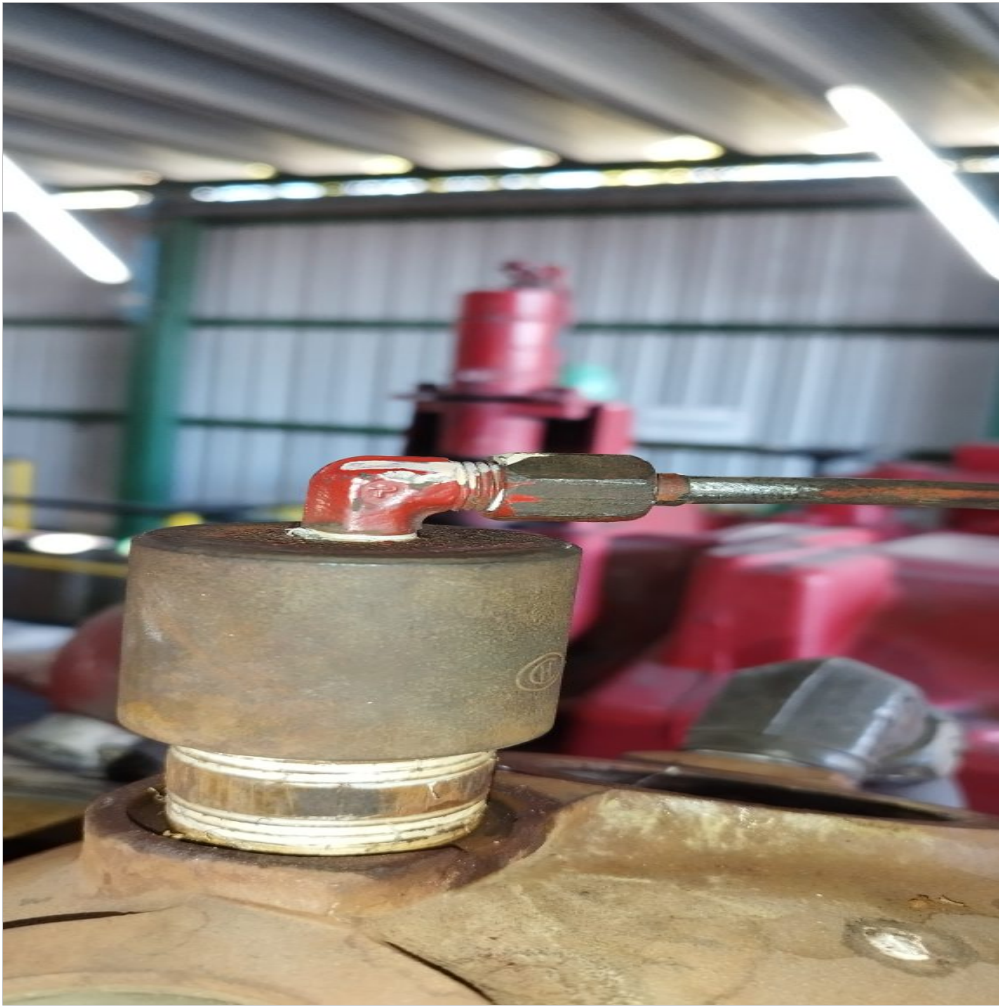
Cañería reparada, destapada y pestaña nueva