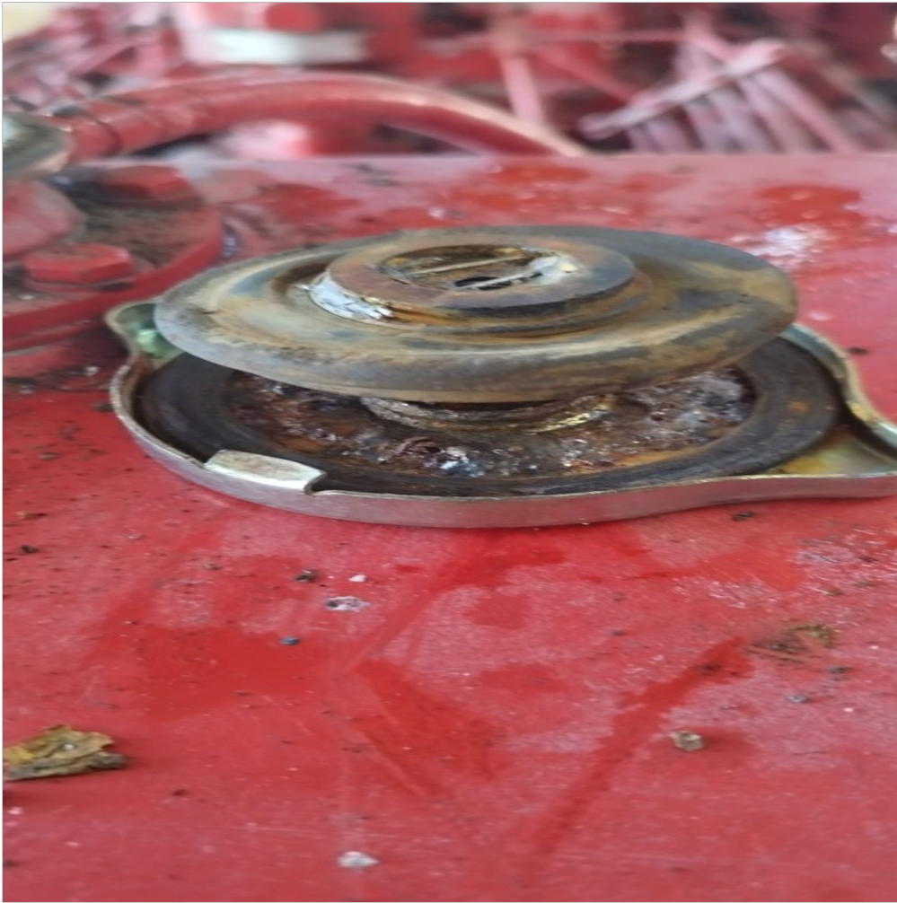
Reemplazar tapa de depósito de refrigerante