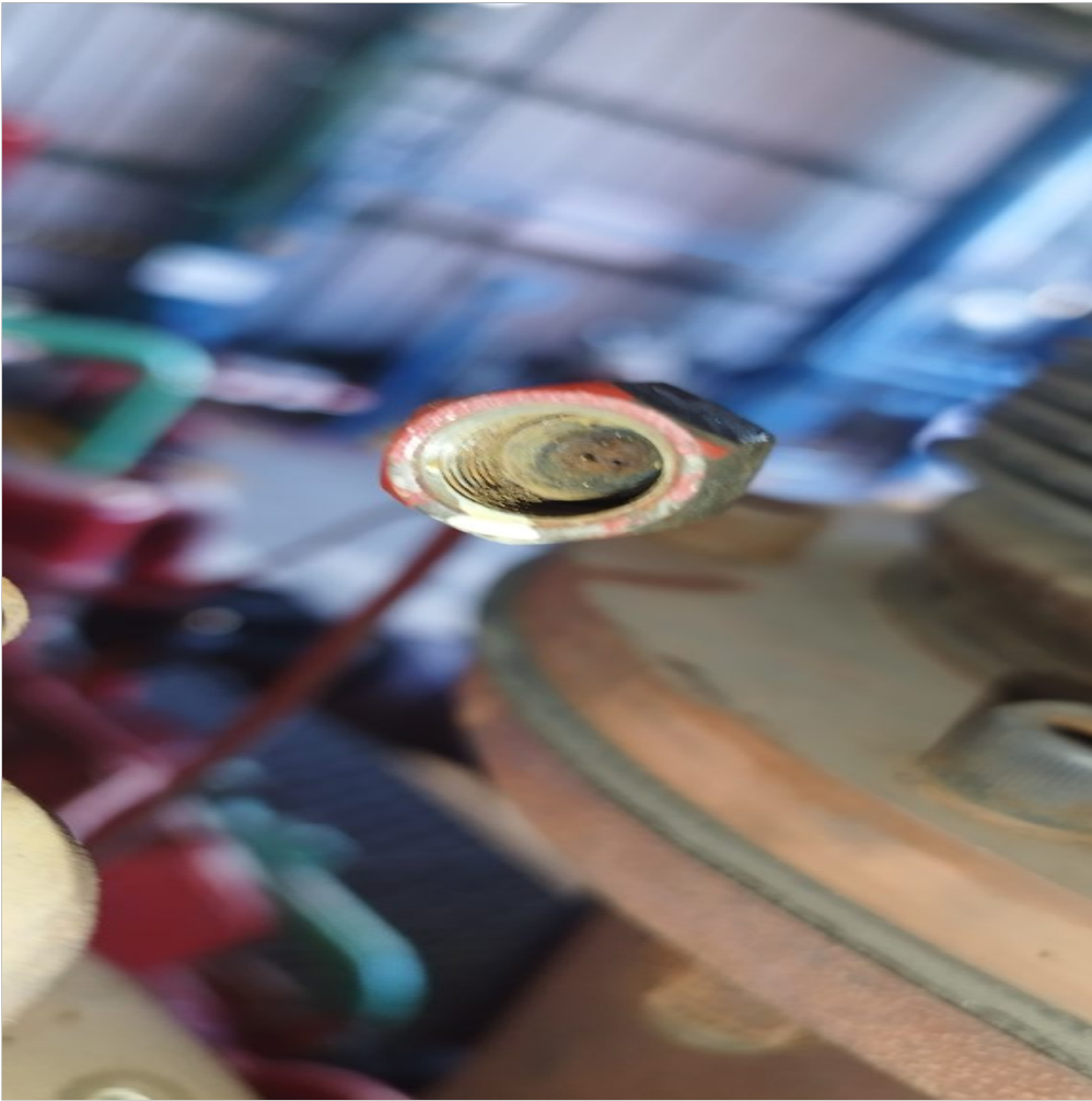
Cañería tapada y dañada