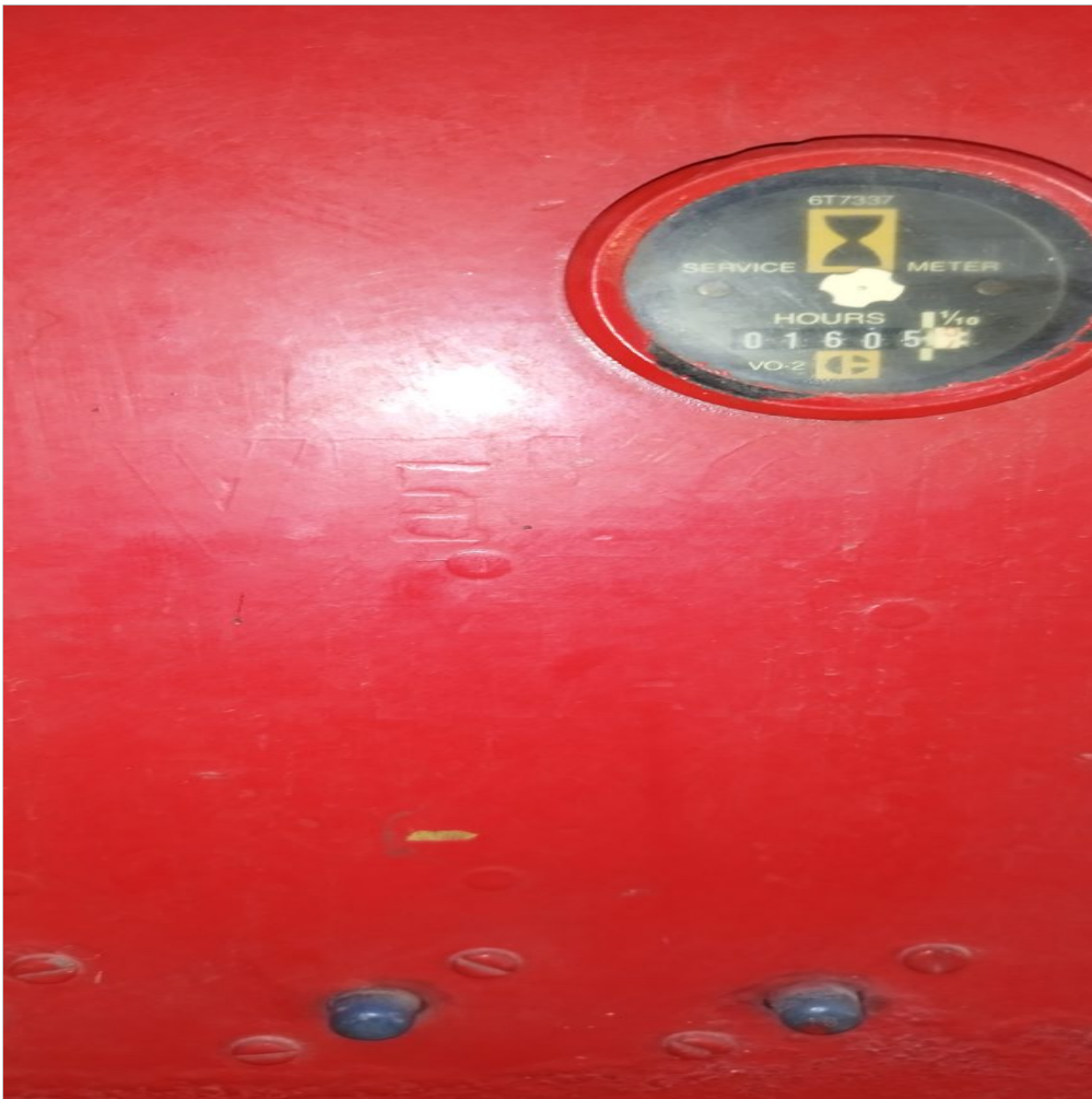
Horometro del equipo