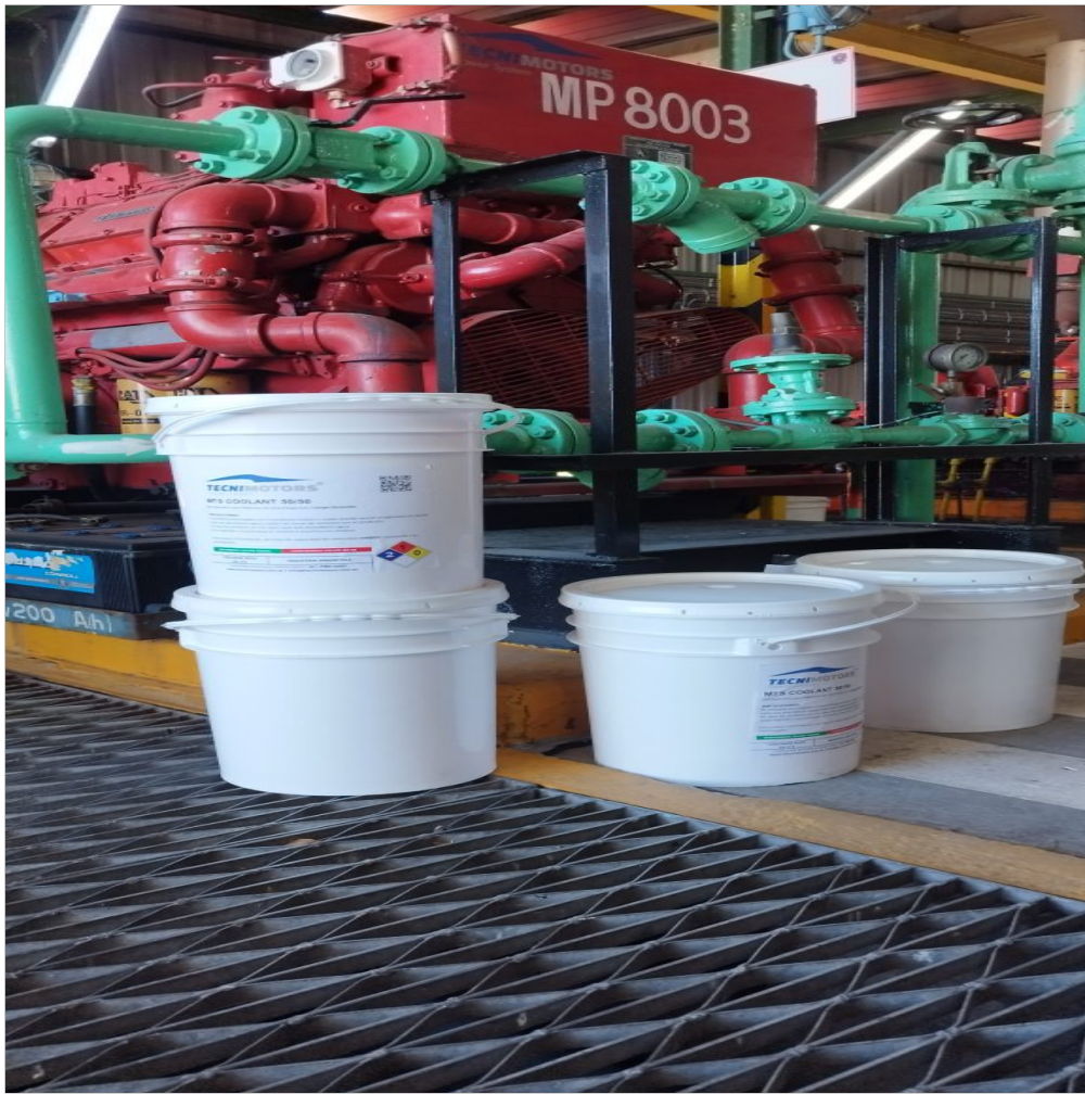
Líquido refrigerante nuevo