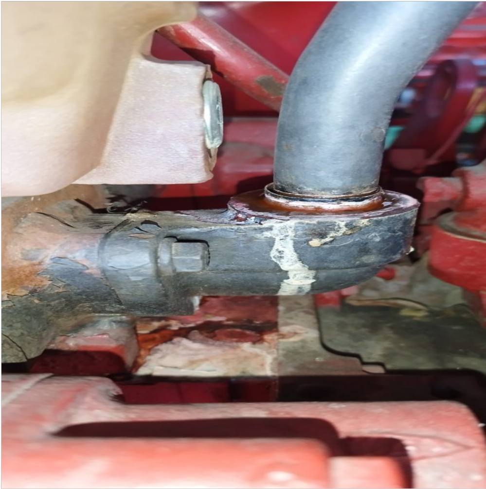
Fuga de refrigerante