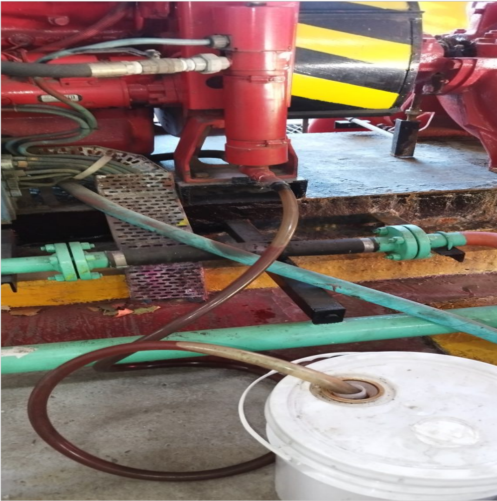
Drenaje de refrigerante